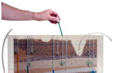
... färben ...