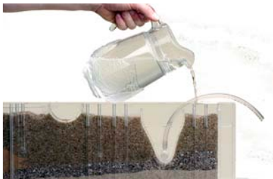
Mit Wasser füllen ...

Der Demokoffer richtet sich vor allem an Lehrpersonen, welche das Thema Grundwasser in ihrem Unterricht behandeln. Das Herzstück ist ein Modell, welches die abstrakten Vorgänge in der Tiefe auf faszinierende Art und Weise anschaulich und verständlich macht!