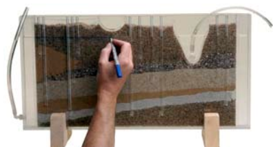
... einzeichnen ...