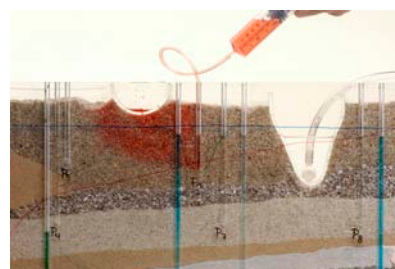
Sickerwasser aus einer undichten Deponie verunreinigt die Grundwasserfassung.

«... Ich habe das Lernprogramm (Demokoffer und Broschüre) mit verschiedenen Stufen (13-jährige Gymnasiasten bis 18-jährige Maturanden) durchgespielt und habe die erfreuliche Erfahrung gemacht, dass sich das Lernprogramm ohne weiteres stufengerecht adaptieren lässt. Ihr Produkt ist professionell umgesetzt, beginnend bei der Verpackung, der Verständlichkeit der Anleitungen, dem Informationsgehalt der Medien, der Adaptation auf das Zielpublikum bis hin zur methodisch-didaktischen Aufarbeitung. Grosses Kompliment! Für den Einsatz an der Oberstufe und den Mittelschulen ist dieses Produkt äusserst wertvoll. ...»