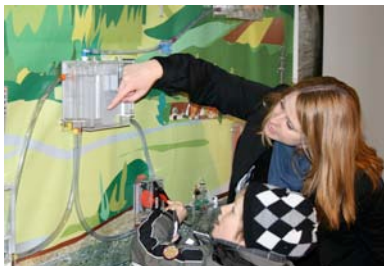
Einsatz am Weltwassertag