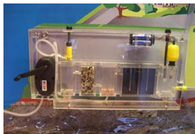
Mehrstufige Wasseraufbereitung beim Seewasserwerk