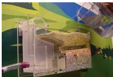
Wassergewinnung bei der Quellwasserfassung

Der praktische Einsatz des Demo-Koffers ist für Wasserversorgungen und Schulen gedacht. Bei Führungen, am Tag der offenen Tür oder anlässlich des Weltwassertages fördert die Gesamtansicht einer interaktiven Wasserversorgung das Verständnis für die Zusammenhänge und dient als attraktiver "eye catcher".