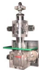
Hydrant im Rohrleitungsnetz