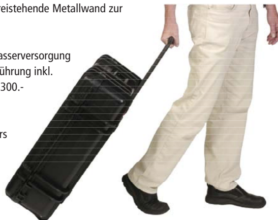
kein mühsames Schleppen dank Rollkoffer mit Teleskopgriff

Beim Kauf eines Koffers können Kundenwünsche berücksichtigt werden!