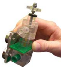
Einfaches Anbringen der Modelle durch Einsatz von Starkmagneten