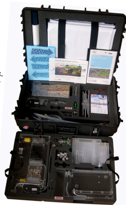
übersichtlich und stossfest verpackt