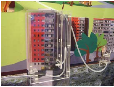
Drucksimulation im Hochhaus