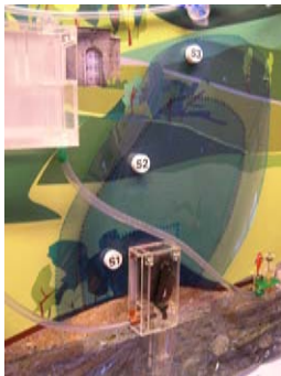
Die Schutzzonefolie wird auf die Hintergrundfolie gelegt